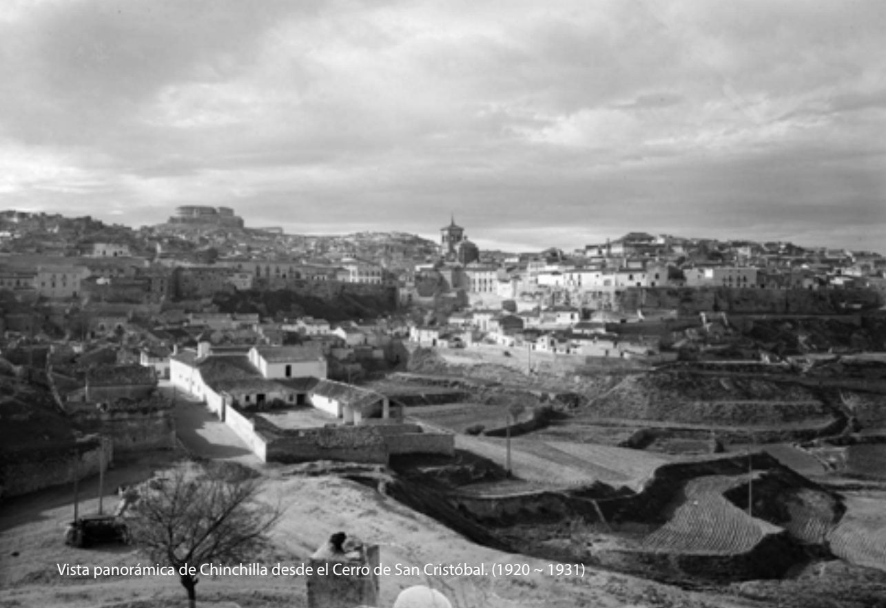
Vista panorámica de Chinchilla desde el Cerro de San Cristóbal. (1920 ~ 1931)