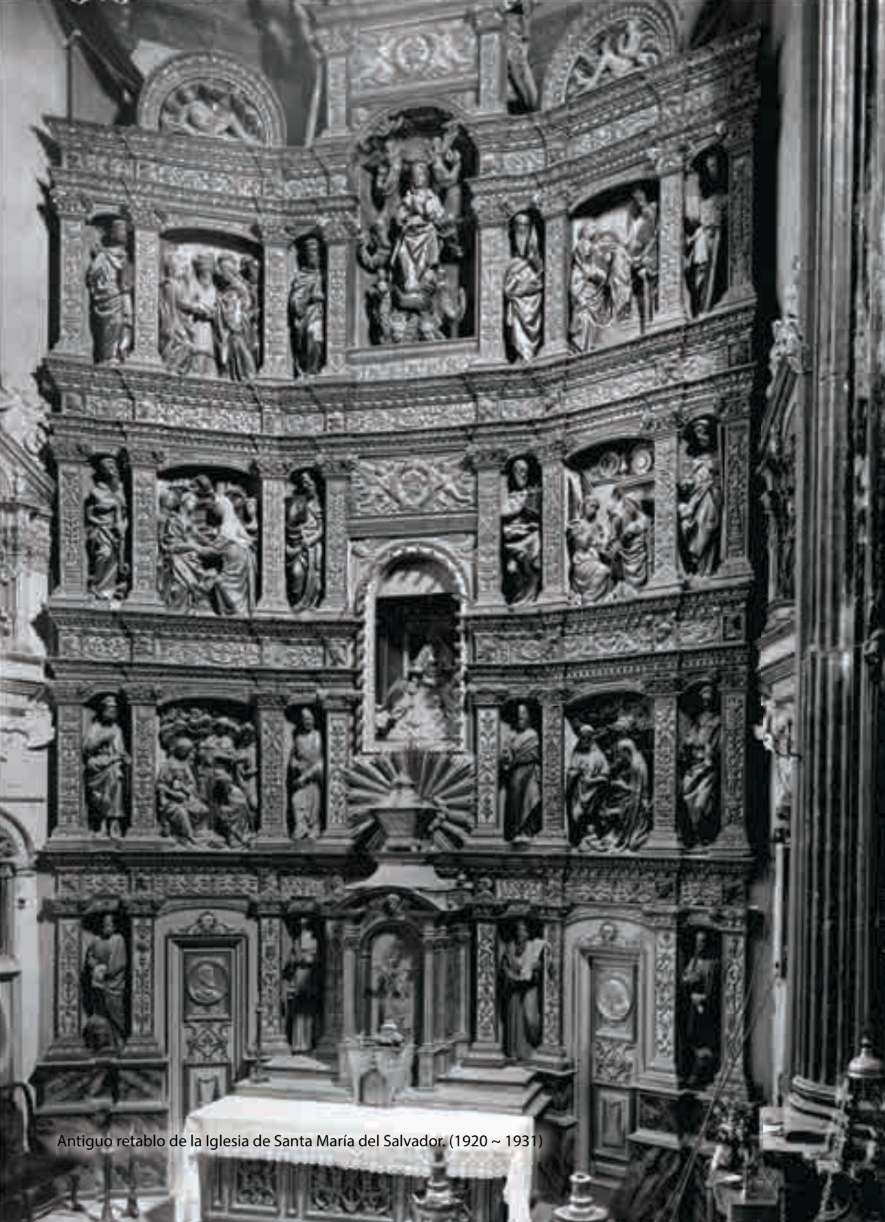
Antiguo retablo de la Iglesia de Santa María del Salvador. (1920 ~ 1931)