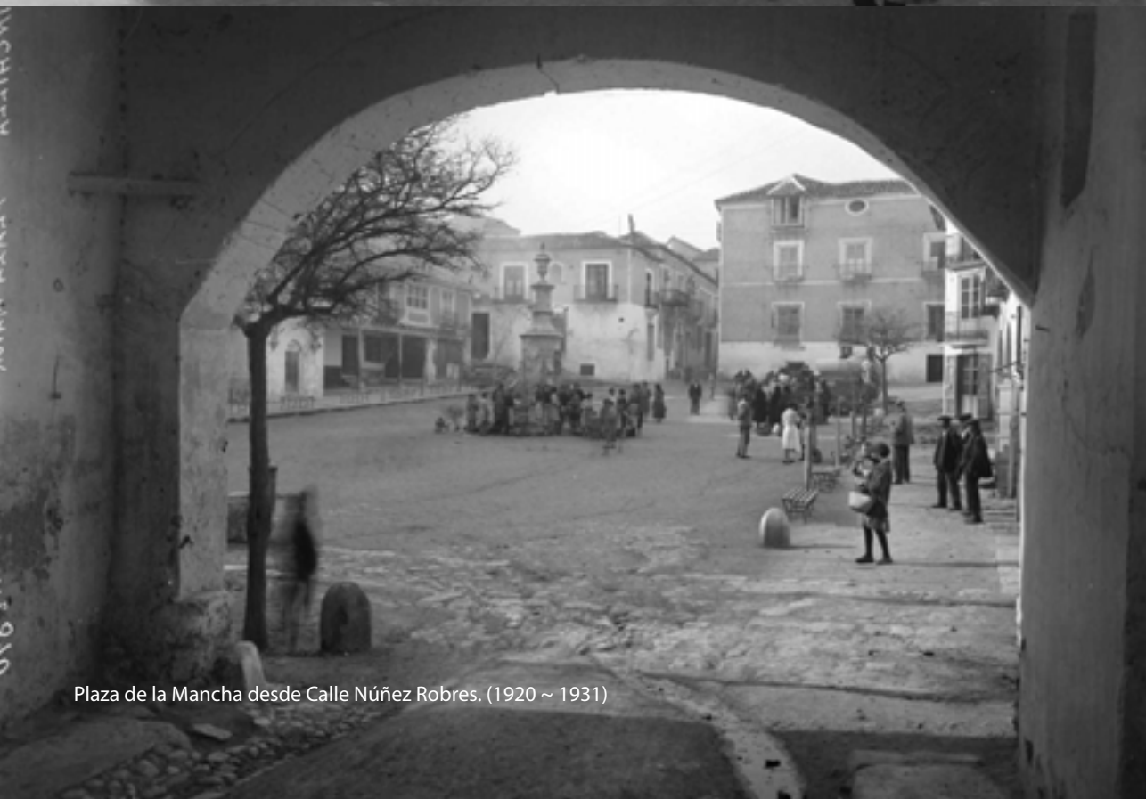
Plaza de la Mancha desde Calle Núñez Robres. (1920 ~ 1931)