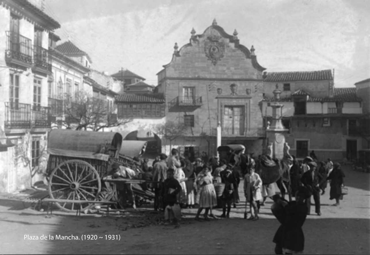
Plaza de la Mancha. (1920 ~ 1931)