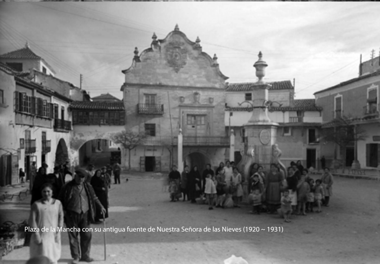
Plaza de la Mancha con su antigua fuente de Nuestra Señora de las Nieves (1920 ~ 1931)