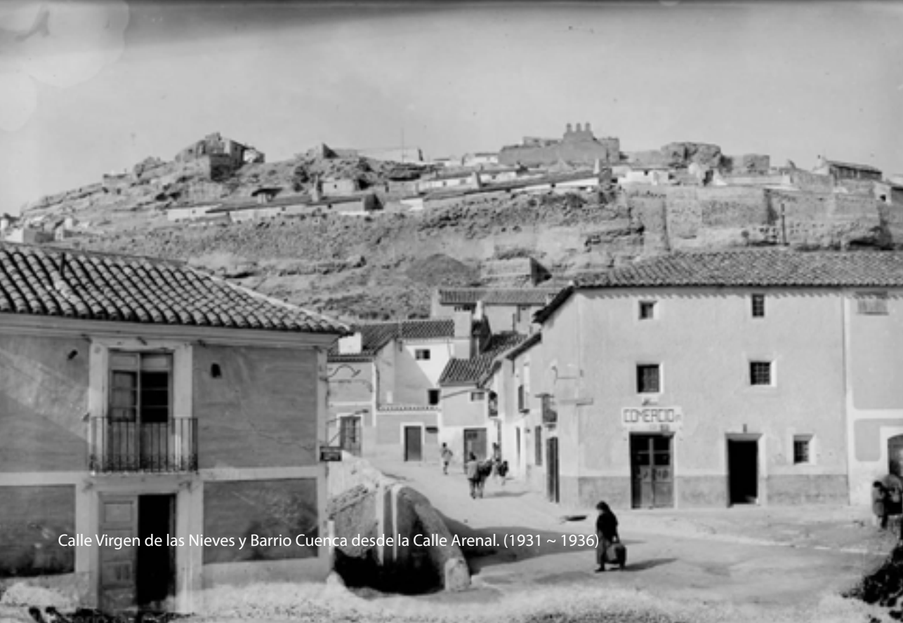
Calle Virgen de las Nieves y Barrio Cuenca desde la Calle Arenal. (1931 ~ 1936)