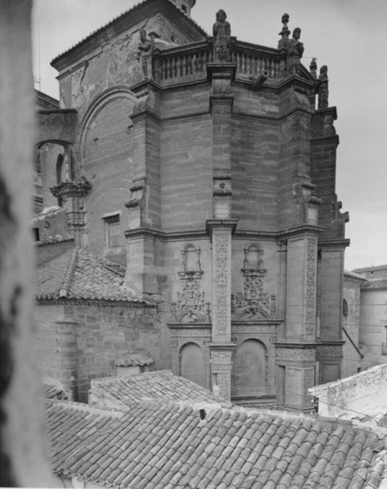
Ábside Renacentista de la Iglesia de Santa María del Salvador, visto desde un ventanal. (1920 ~ 1931)