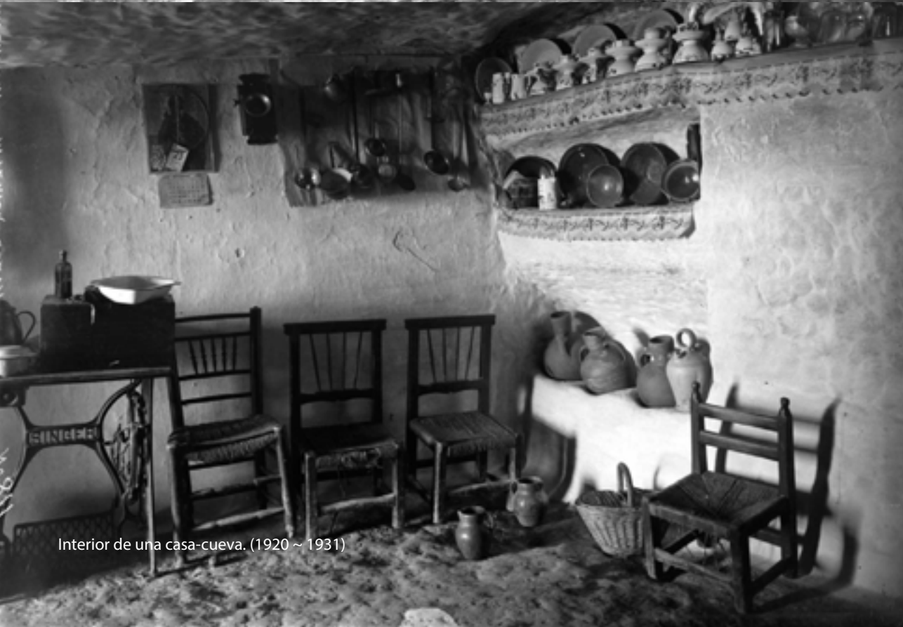
Interior de una casa-cueva. (1920 ~ 1931)