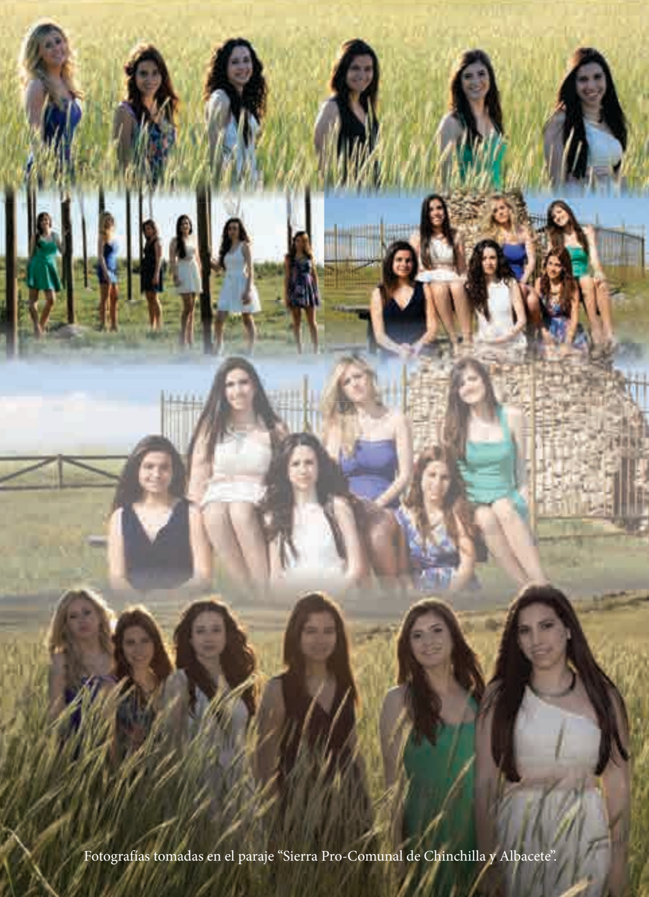
Fotografías tomadas en el paraje “Sierra Pro-Comunal de Chinchilla y Albacete”.