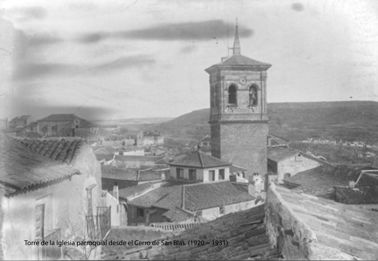
Torre de la Iglesia parroquial desde el Cerro de San Blas. (1920 ~ 1931)