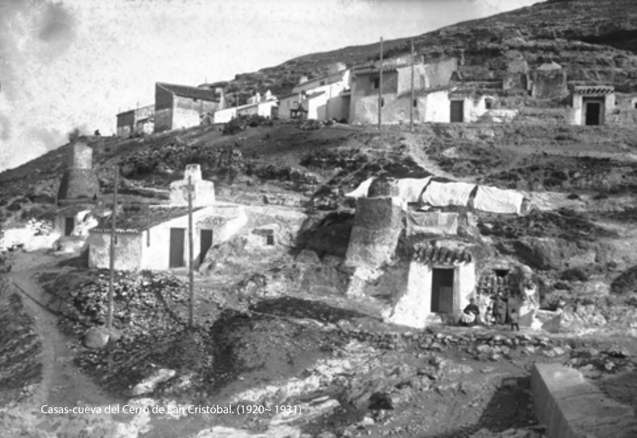
Casas-cueva del Cerro de San Cristóbal. (1920~ 1931)