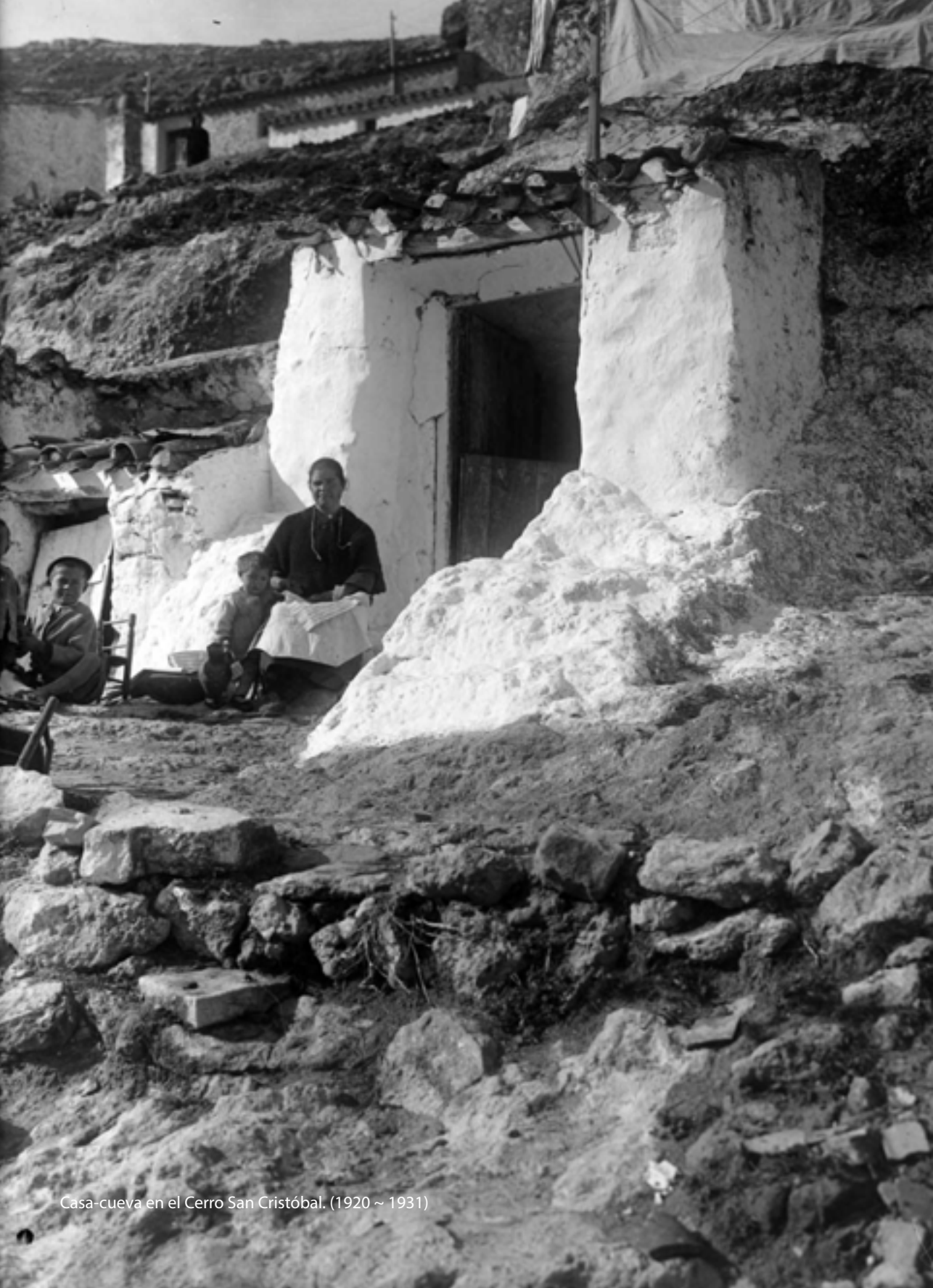
Casa-cueva en el Cerro San Cristóbal. (1920 ~ 1931)